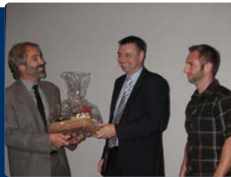
Souper-bénéfice de Richmond-Arthabaska