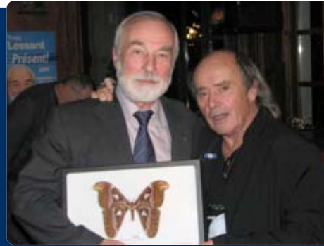
Cocktail de financement et assemblée générale dans Chambly-Borduas