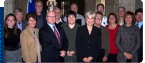
Conférence de presse conjointe avec les représentants de la Fédération de l'âge d'or du Québec (FADOQ)