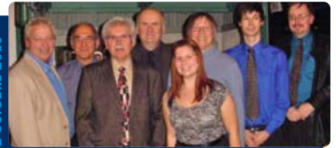
Assemblée générale annuelle dans Portneuf-Jacques-Cartier