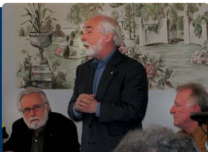
La Coalition du Corridor de l'Oléoduc Montréal-Portland