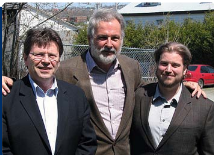
Assemblée générale du Bloc Québécois de Sherbrooke