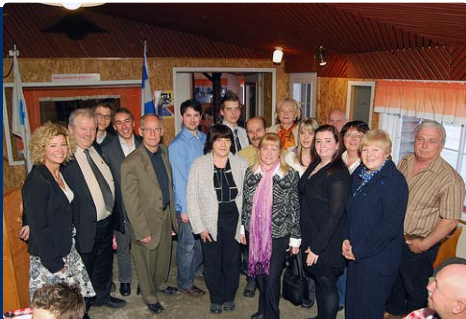
Nouveau conseil exécutif de Montcalm