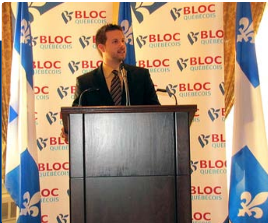
Cocktail de financement de Repentigny