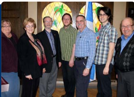
Assemblée générale annuelle du BQ d'Abitibi-Baie-James-Nunavik-Eeyou