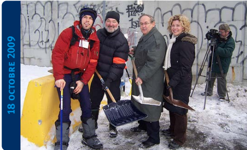
Activité « Pellete-In » organisée par le collectif Vélo 365