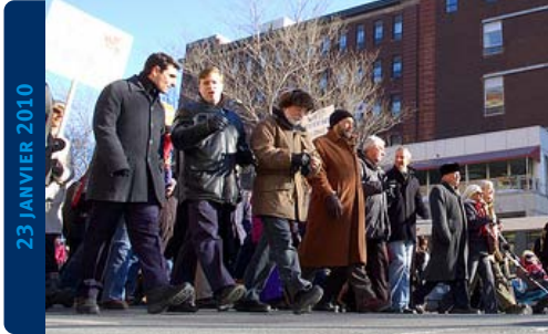
Manifestation contre la prorogation du Parlement