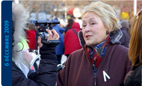
Manifestation contre la violence faite aux femmes