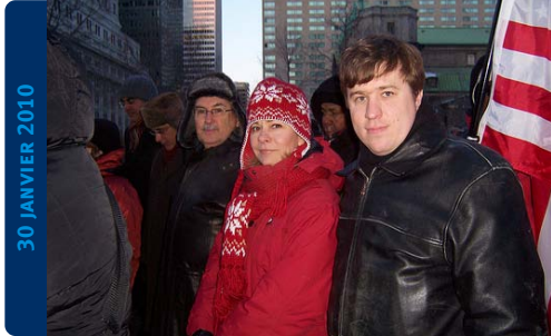
Mon cœur avec Haïti