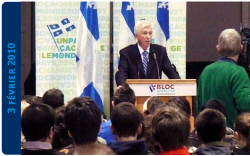
Gilles Duceppe à l'Université d'Ottawa