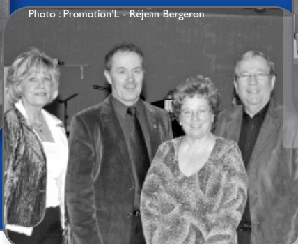
▲ BÉCANCOUR Finales régionales de patinage artistique et Jeux du Québec régionaux, région Centre du Québec.