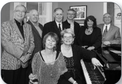
Sorel-Tracy - Ouverture de la maison de la musique