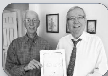
40 e anniversaire du Club Fadoq de Fortierville