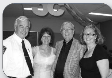
35 e anniversaire du Centre d'action bénévole de Nicolet