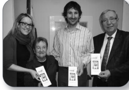
Fortierville - Inauguration du vestiaire