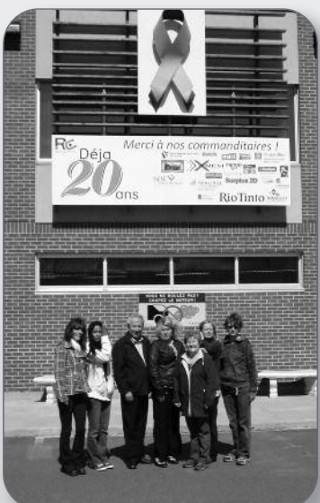
20 e anniversaire du Recylo-Centre de Sorel-Tracy