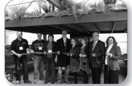
Nicolet - Journée « Porte ouverte » de l'Ecole d'agriculture