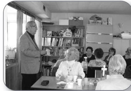
Saint-François-du-Lac - Dîner de la popote roulante