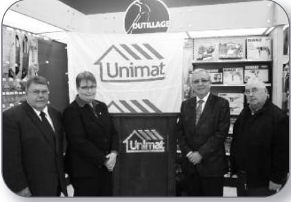
Baie-du-Febvre - Inauguration de la quincaillerie Unimat