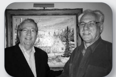
40 e anniversaire du Club Fadoq de Saint-François-du-Lac