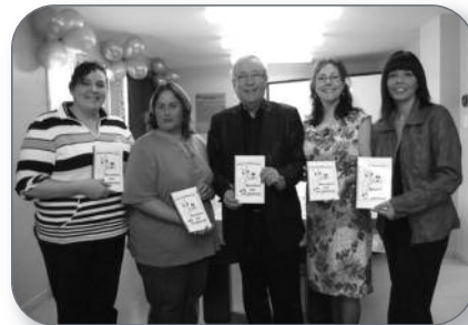
Sainte-Angèle-Laval - Lancement d'un livre de recette du Centre du Plateau Laval