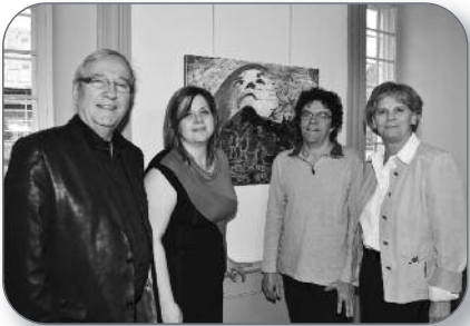
Nicolet - Vernissage à l'Ecole nationale de police