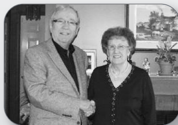
40 e anniversaire du Club de l'âge d'or de Saint-David