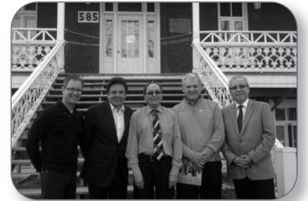
Saint-Léonard Astonm - Campagne de financement du Centre de l'Assomption