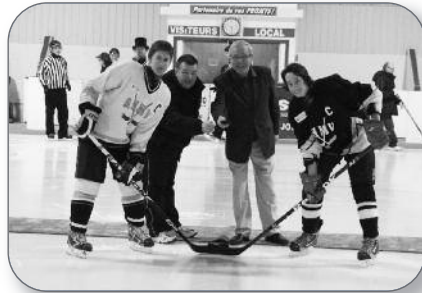
Saint-David - Mise au jeu protocolaire du tournoi annuel de hockey