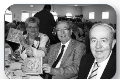
30 e anniversaire du Club Fadoq de Saint-Roch-de-Richelieu