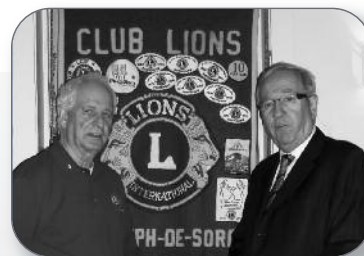
25 e anniversaire du Club Lions de Saint-Joseph-de-Sorel