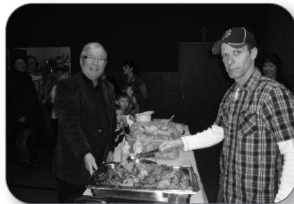
Sainte-Eulalie - Brunch Café du Clocher