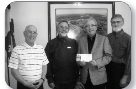
Sorel-Tracy - Rencontre avec des représentants de Développement et Paix