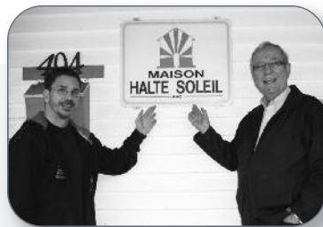
25 e anniversaire de la Maison Halte-Soleil de Saint-Joseph-de-Sorel