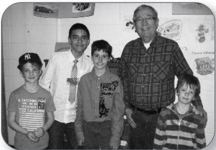
Saint-Ours - Musée antique des jeunes de 5 e et 6 e année