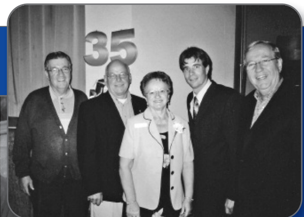
▲ SAINT-ZÉPHIRIN-DE-COURVAL 35 e anniversaire du Club de l'âge d'or de Saint-Zéphirin-de-Courval