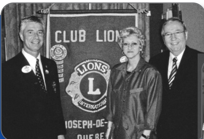
▲ SAINT-JOSEPH-DE-SOIRE 20 e anniversaire du Club Lions de Saint-Joseph-de-Sorel.

« Le gouvernement doit maintenant montrer qu'il respecte le processus démocratique et considérer sérieusement nos recommandations, » a conclu le député.