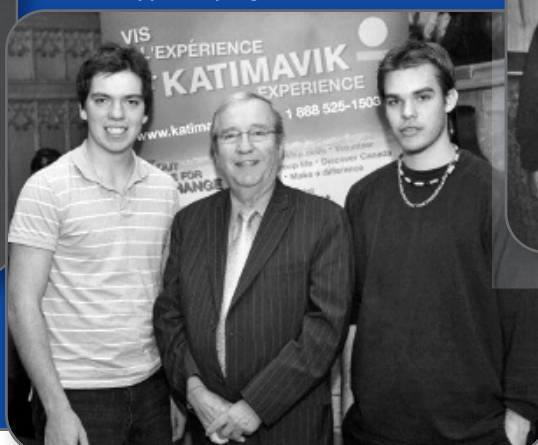
▼ KATIMAVIK Appui au programme Katimavik.