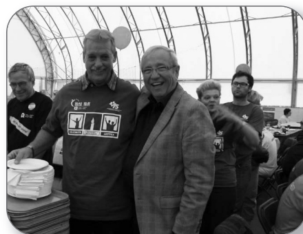
Relais pour la vie à St-Grégoire