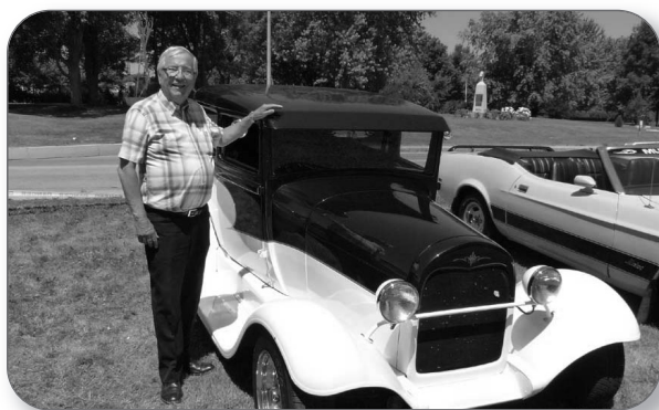
Belles d'autrefois à Nicolet