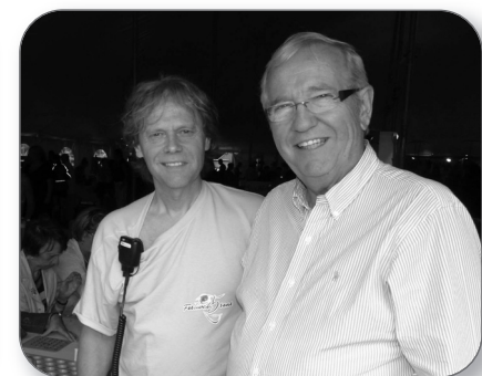
Bingo au Festival des 5 Sens de Sainte-Sophie-de-Lévrard