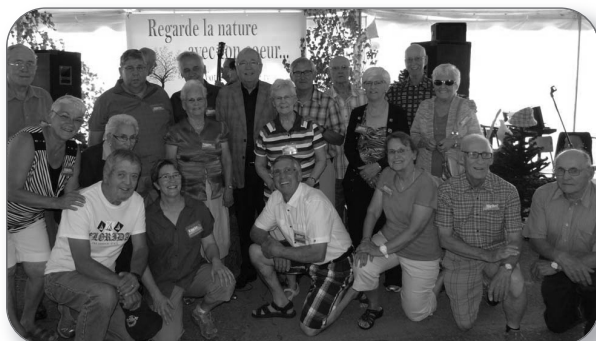
Fête familiale à Fortierville