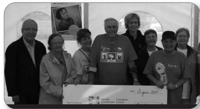
Relais pour la vie à St-François-du-Lac