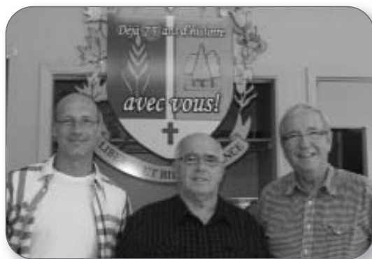
75 e de la municipalité de Grand-St-Esprit