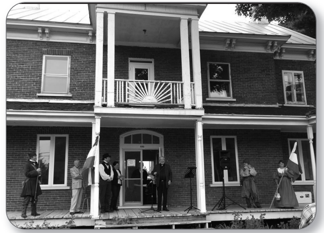
Journée des Patriotes à Saint-Roch-de-Richelieu

L'Assemblée nationale du Québec a adopté une motion à trois reprises dans le passé pour dénoncer ce projet. Les milieux d'affaires québécois appuient le gouvernement du Québec dans ce dossier.