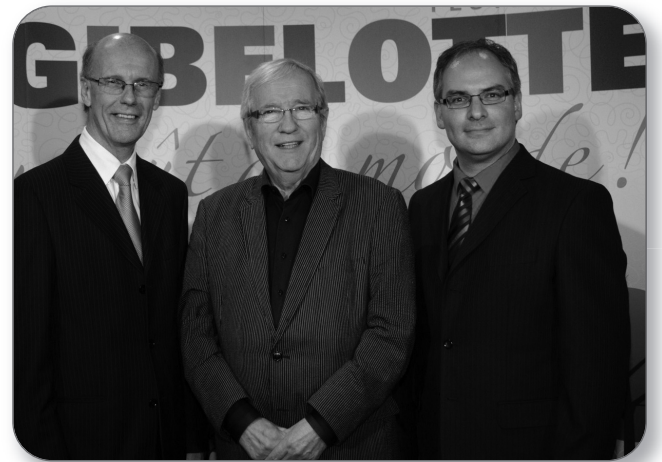
Lancement de la programmation du Festival de la Gibelotte