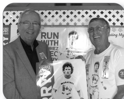
Journée Terry Fox à Fortierville