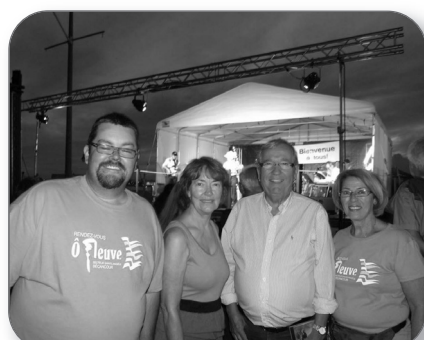
« Rendez-vous Ô Fleuve » à Ste-Angèle