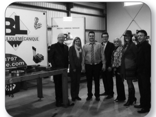
Agrandissement de BL Hydraulique-mécanique de Sorel-Tracy