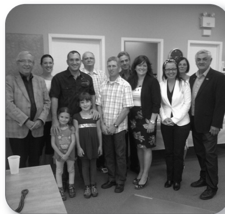
Ouverture du nouveau bureau municipal de St-Robert

Peu importe les conséquences de ce remaniement ministériel, le Bloc Québécois continuera incessamment d'interpeller les ministres fédéraux sur les enjeux du Québec afin que les politiques d'Ottawa respectent les valeurs et les intérêts de la nation québécoise.