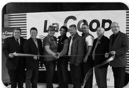
Ouverture officielle du plan d'engrais de Covilac à Baie-du-Febvre