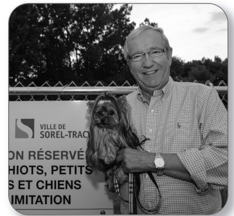
Ouverture du parc réservé à la promenade de chiens à Sorel-Tracy

Rappelons que le chef du NPD a de l'expérience en matière de contestation des lois fondamentales du Québec, lui qui a été directeur des affaires juridiques au sein d'Alliance Québec, un organisme qui visait à contester et à affaiblir la Charte de la langue française.