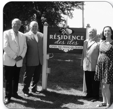
25 e OMH Ste-Anne-de-Sorel

« Les Québécoises et les Québécois sont ouverts, tolérants et solidaires. Ils sont parfaitement capables d'aborder le défi de la diversité dans le respect de toutes et de tous. Le Bloc Québécois s'opposera donc fermement à toutes les manœuvres des partis fédéralistes d'Ottawa en vue de limiter la liberté des Québécoises et des Québécois de définir eux-mêmes leur société. Cela est non négociable ! » a conclu Louis Plamondon.