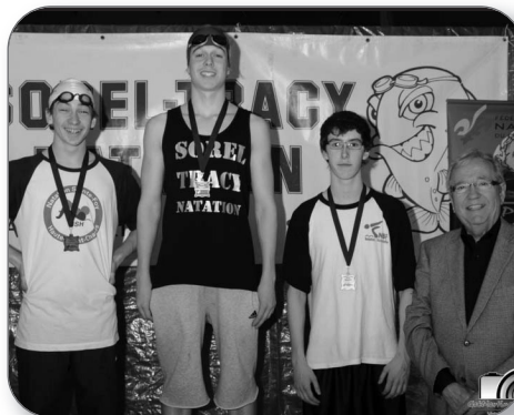
Compétition de natation à la piscine Ménard