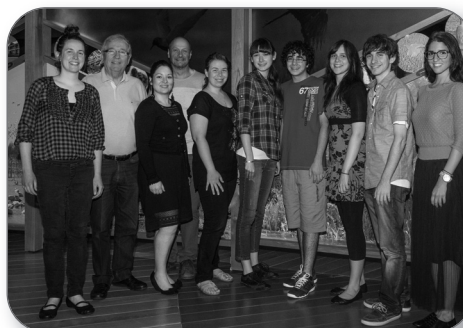
Visite au Biophare de Sorel-Tracy