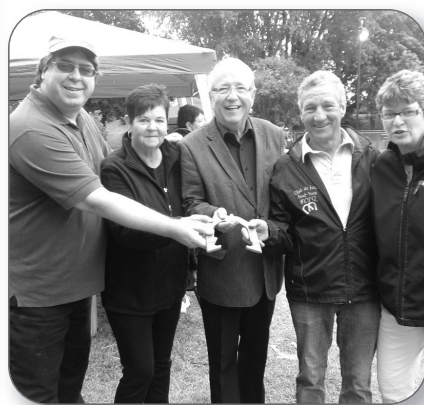
Tournoi provincial de fers tenu à St-Joseph-de-Sorel