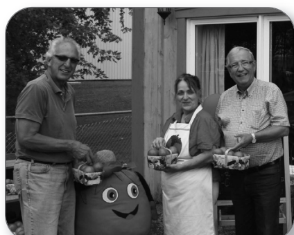
Fête de la tomate à Saint-Pierres-Becquets