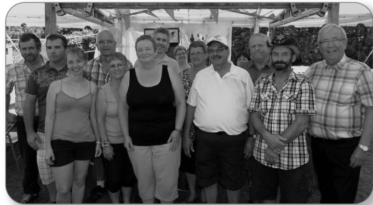
Festival country de Ste-Monique