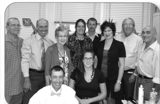
Pièce de théâtre à Ste-Françoise au profit du centre multi-fonctionnel