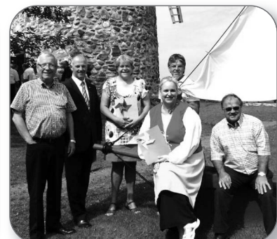
Festicadie au Vieux Moulin de St-Grégoire