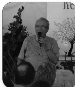
Fête familiale à St-Pierres-Becquets au centre d'hébergement Romain-Becquet