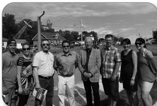
Inauguration des jeux d'eau à Parisville