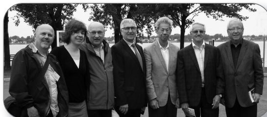
Rendez-vous de la photo à St-Joseph-de-Sorel