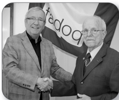
5 e anniversaire : construction de la salle de la FADOQ de Ste-Angèle-de-Laval