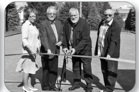
Inauguration du Criquet à Sainte-Eulalie