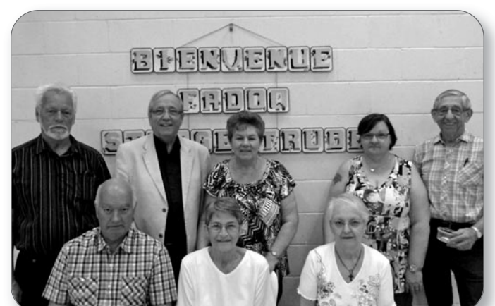
Visite à la FADOQ de Sainte-Gertrude