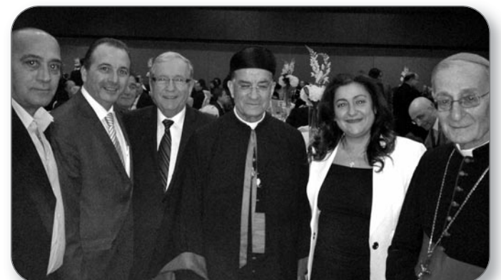
Rencontre avec son excellence Mar Bechara Boutros-Alraï, Patriarche Maronite d'Antioche