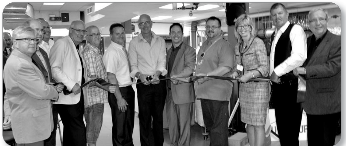
Inauguration de la buanderie du CSSS Pierre-de-Saurel