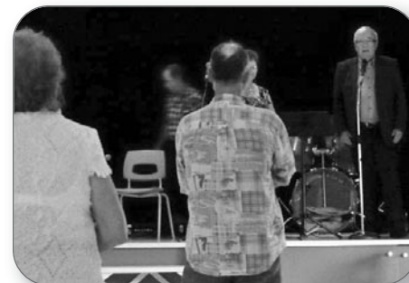
Une « petite histoire » au Gala folklorique de Manseau