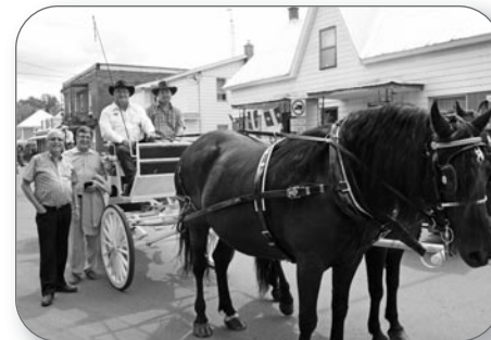
Fête nationale à Massueville