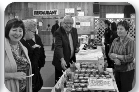
Visite au Salon des Trois Grands « A » à Grand-Saint-Esprit